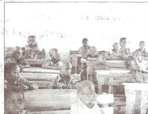
Les premiers élèves de l'EPP Elias Farakhan de Gbalo.